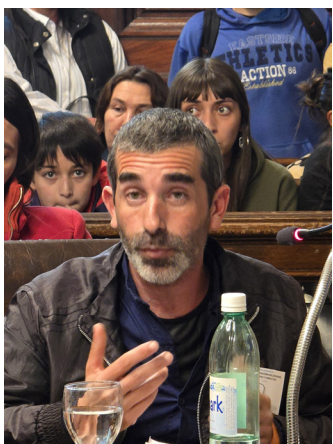
Parlamento: Quiroga, Partido de 9 de Julio